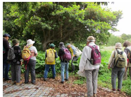
郷土再発見講座 「初夏の辻堂海岸で 道ばたの植物と浜辺の植物を楽しむ」