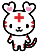
ハートフル 日本赤十字社 神奈川県支部