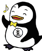
ホゴちゃん 更生保護 マスコットキャラクター