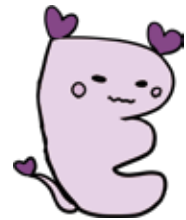
ふくちゃん イラスト：うに猫タコ

地域の福祉活動は、市の地域福祉施策と相互に連携・協働していくことが必要です。本活動計画においても、行政計画である「藤沢市地域福祉計画2026」の推進ビジョンと3つの基本目標に整合した方向性としてします。