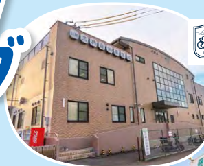
神奈川県公安委員会指定 SANKYO 三共自動車学校