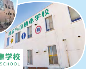
藤沢高等自動車学校 FUJISAWA DRIVING SCHOOL