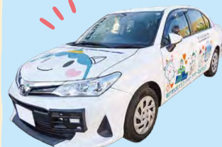
藤沢市とコラボした シティプロモーション教習車

自動車学校としての教習以外に、三共自動車学校では地域の方々に向け定期的にパンの販売をしていたり、藤沢高等自動車学校では地域の幼稚園で交通安全教室をおこなっています。株式会社キャリアドライブは今年で創業60周年を迎えます。60年間やってこられたのはやはり地域の方々あってのことであり、この60年の感謝を、地域の方々に還元していきたいと考えています。この事業をはじめ、地域に根ざした取り組みを広げていき、藤沢市がより活性化していけるよう願っています。