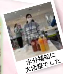
水分補給に 大活躍でした