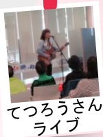
てつろうさん ライブ