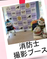
消防士 撮影ブース