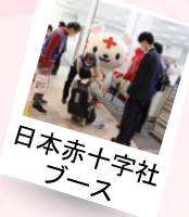
日本赤十字社 ブース