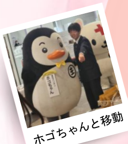
ホゴちゃんと移動

学生を中心とした「ユースボランティア」の皆さんには、無料で麦茶を提供する「麦茶カフェ」での接客や、マスコット握手撮影会のボランティア等にご協力いただきました！