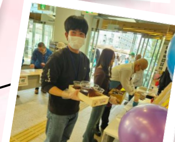
来場者の方へ ドリンクサービス