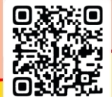
ホームページはこちら

参加した事で普段体験することができない盲導犬や、目が見えない方への対応を経験できました。