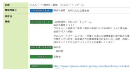
募集をクリックすると詳細が見えます