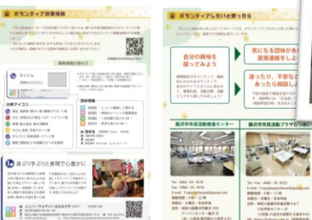
特集記事もあります

藤沢市市民活動推進センターが発行しているボランティア情報冊子で、ボランティア募集情報も掲載しています。市内の公共施設などで配布しているほか、Web版でも配信しています。