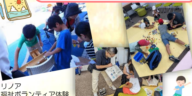
リノア 福祉ボランティア体験

・今回ご参加いただいたお二人の活躍で、参加した皆さんも安心して楽しい時間を過ごせたとおもいます。ご協力ありがとうございました！