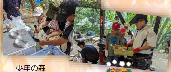
少年の森 みんなでバーベキュー

ボランティアの経験がなかったので不安もありましたが、ボランティアセンターへ相談に行ったことでハードルが下がりました。具体的にやりたいことが決まっていなくても、少しでも興味があればその気持ちを大事にいただきたいと思います。