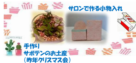
サロンで作る小物入れ

役員の方々を中心に、様々な工夫を凝らして毎月こころ温かいサロンを開催しています。2月、3月はコロナ禍で中止となりましたが4月は小物入れ作りを行う予定です!