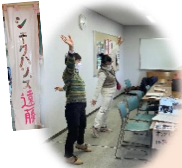
体操をオンライン中継♪

遠藤市民センター3階にて遠藤版あなたの人生会議が2月18日に開催されました。20組の専門機関や企業・団体が参加し「終活」をテーマにした様々な内容の展示・紹介がされる中、シェークハンズ遠藤も参加してブースを出展しました。