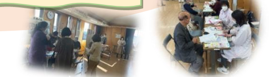
メイクや写真撮影コーナー、相談ブースなど盛りだくさん!!