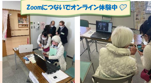
Zoomにつないでオンライン体験中♡