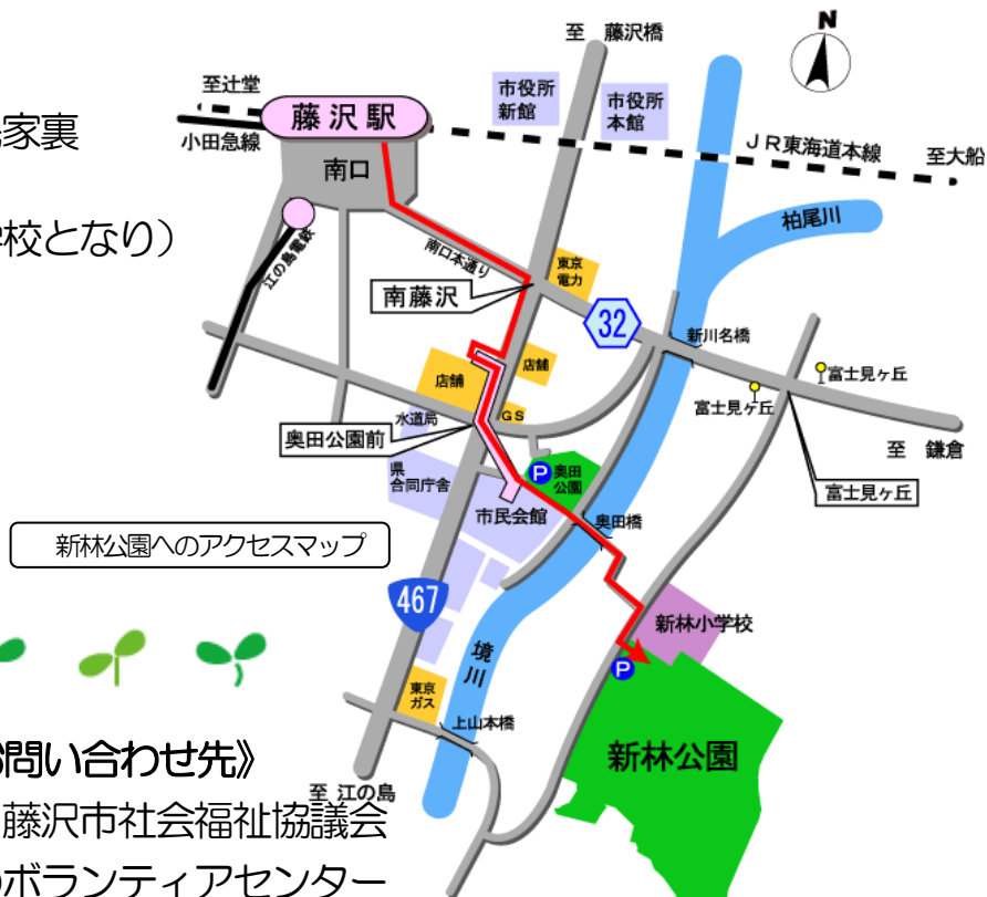
新林公園へのアクセスマップ